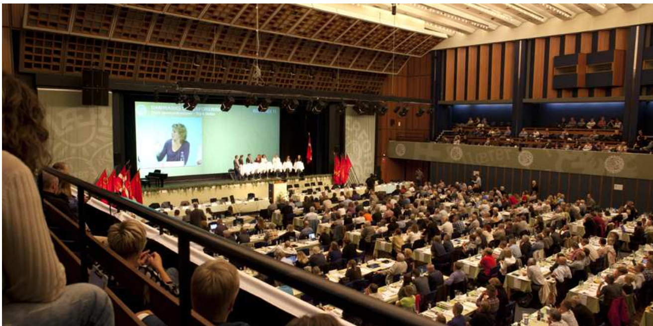
Falkonersalen var godt fyldt op af de mange delegerede.