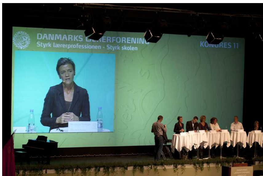
Dagen før folketingsvalget – valgmøde på DLF's kongres.